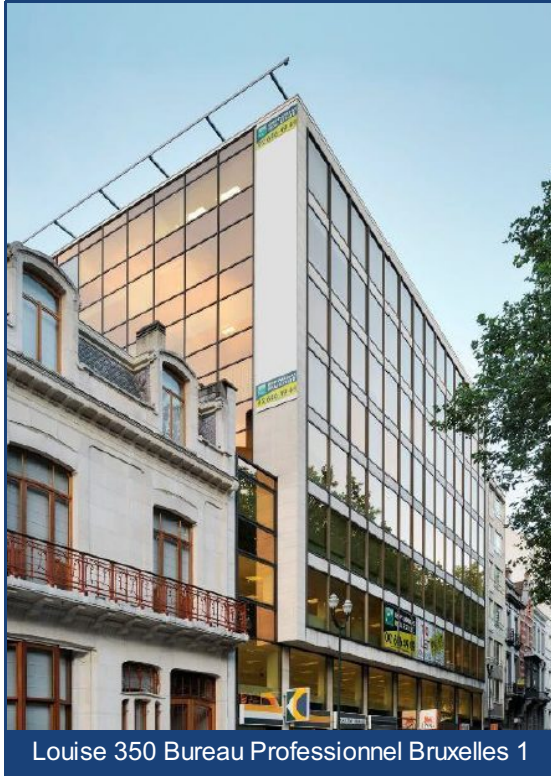
Louise 350 Bureau Professionnel Bruxelles 1