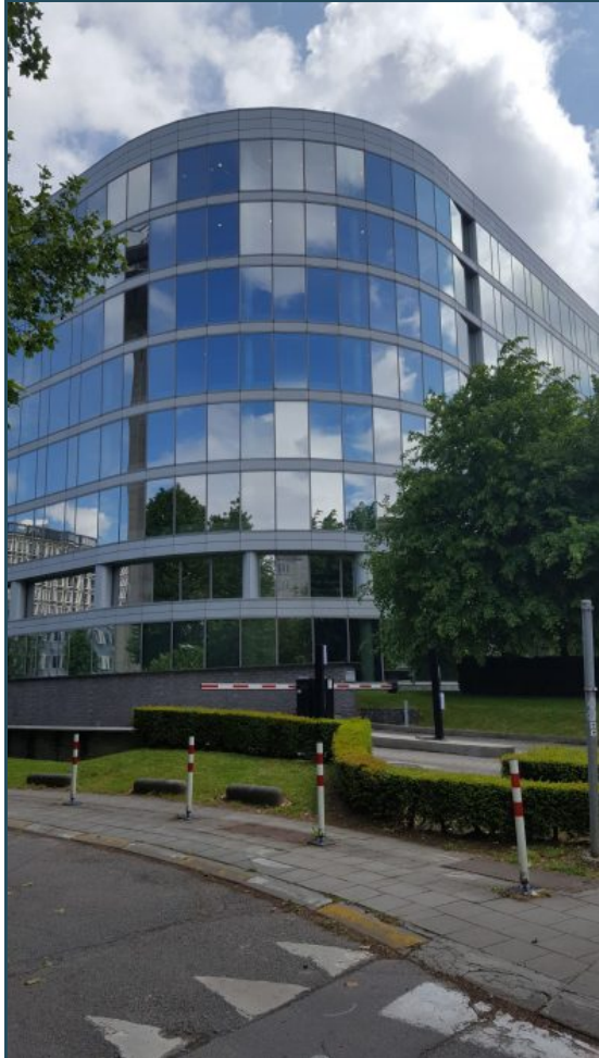
Reyers 70 Location Bureau Bruxelles 1